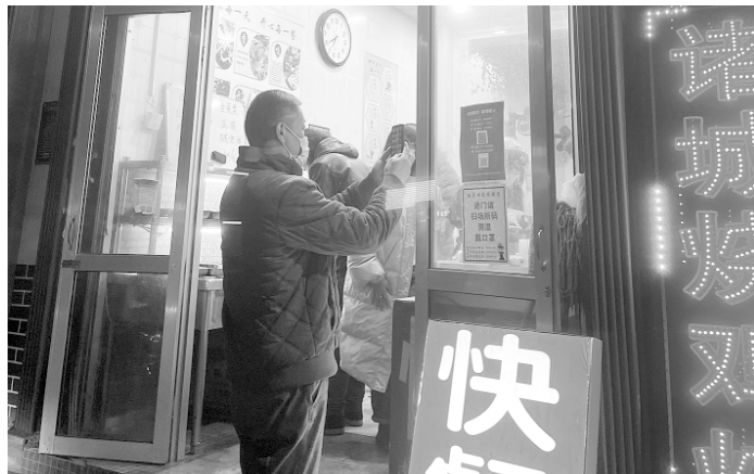
在辣疙瘩快餐店,顾客扫码进店。

11月30日上午,记者来到位于经济区乐川东街与文化路交叉口附近的好鲜生水果店,扫描场所码