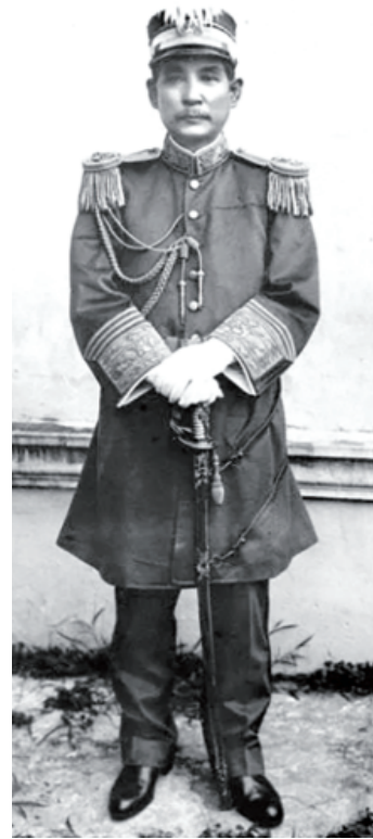
1912年就任大元帅时的孙中山。