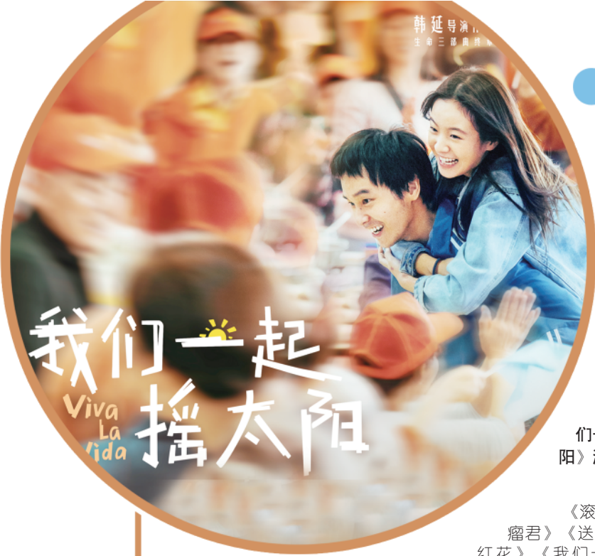
电影《我们一起摇太阳》海报