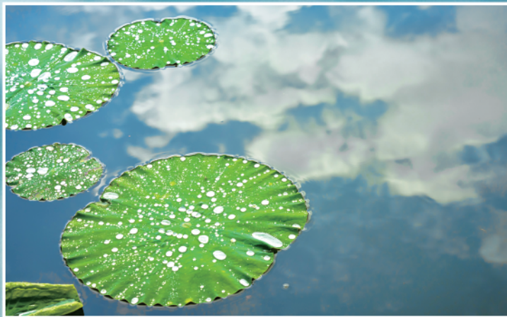
▲荷塘里的倒影 ▼“撑伞”的鸟儿