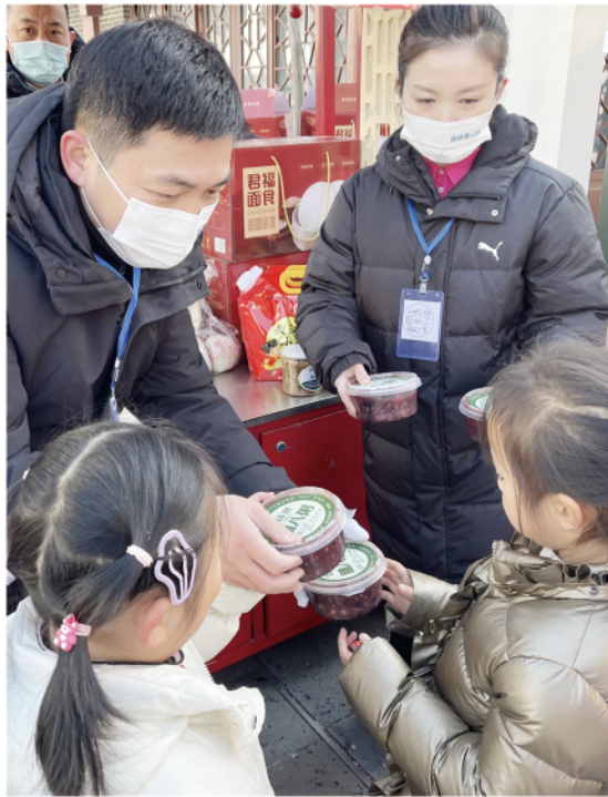
小朋友领到热乎乎的腊八粥。

不仅送腊八粥,现场还邀请医护人员免费为市民提供爱心义诊。中医文化宣传推广、中医药专家义诊、口腔及眼科医院免费检查等活动,普及疾病防治健康知识,增强群众防病治病的健康意识。