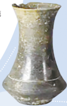
胶河东岸高密前冢子头遗址出土的龙山文化时期蛋壳陶杯