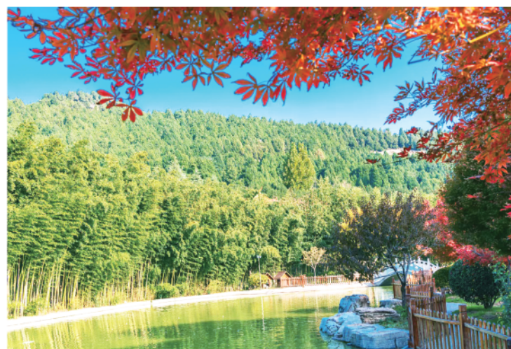
小图组图：昌乐县首阳山森林公园里的美丽秋景。