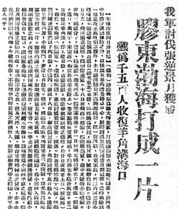
1945年5月17日《解放日报》报道