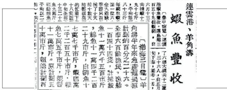
1949年7月9日《大众日报》报道