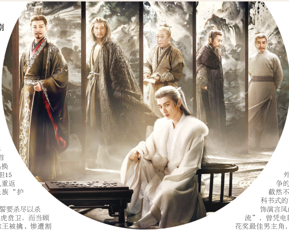
《长安二十四计》海报

计》《长安十二时辰》等古装剧的智斗、悬疑感就更突出,展现出原创剧本自由裁量的优势,实现了通过给情节做“减法”从而为剧情“加分”的预期。