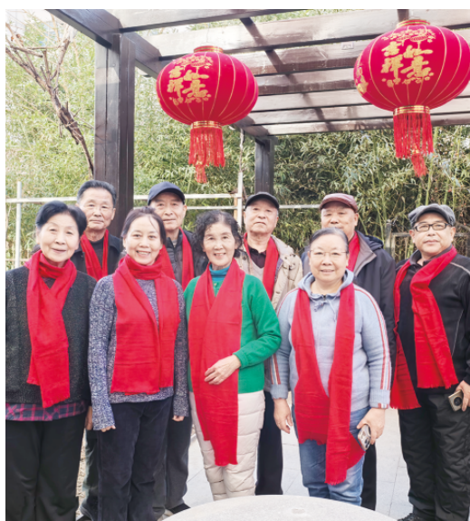
部分潍坊市红艺校师生。