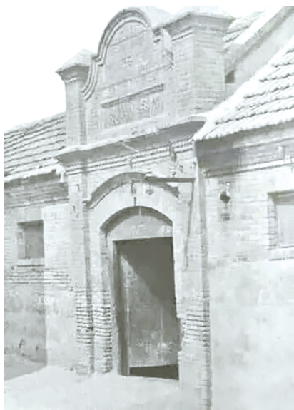
潍坊市红艺校建于继志小学旧址。