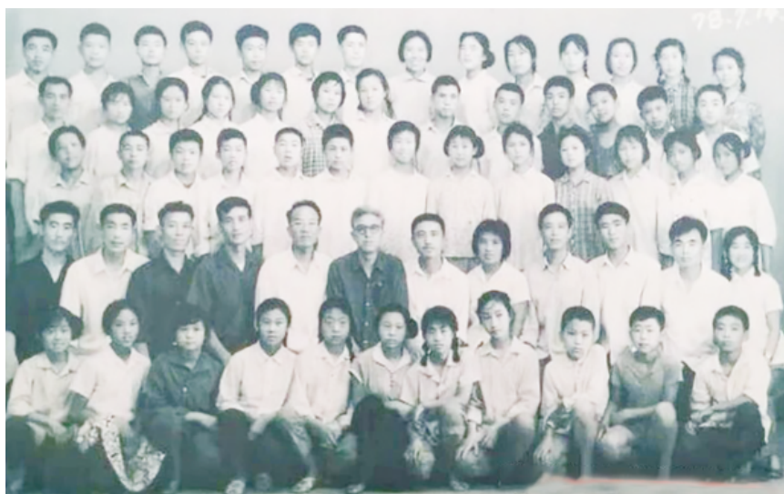
潍坊市红艺校首届初中、小学毕业生合影