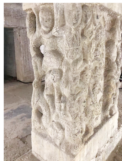
前中室间方柱北面实景