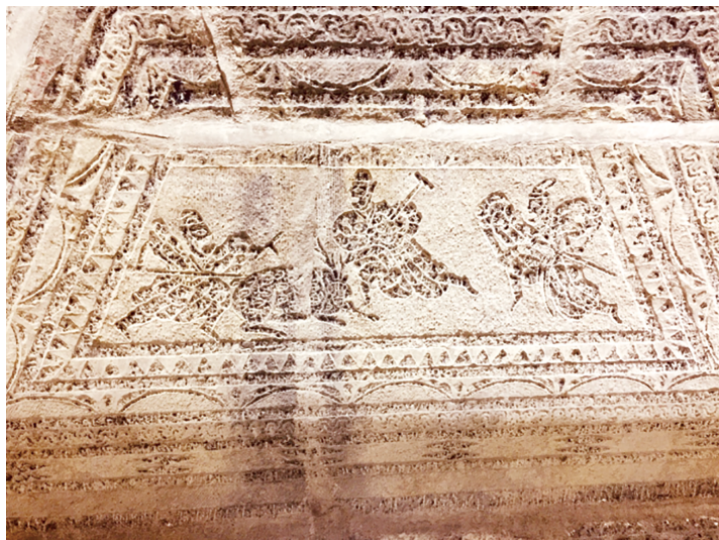
后墓室东间室顶南坡三士争鹿实景