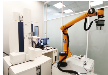
智能透射电镜系统“原眼一号”

团队长期致力于透射电镜软硬件智能化、一体化研究,联合中国科学院沈阳自动化研究所韩志研究员团队开发了“全自主感知-解析-操控通用智能透射电镜系统”算法,并在此基础上,攻克具身智能高真空样品传递、电子光学成像自主调节、纳米级样品智能定位、图像自主采集与实时解析、全系统状态感知与调度协作五大关键技术,成功研制